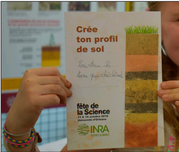
Figure 6 - Customize your profile.