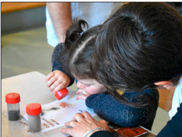
Figure 4 - Making of the profile a) with a skaker or b) hand-made.

Figure 4 - Réalisation du profil a) à l'aide de la salière à sol ou b) à la main.