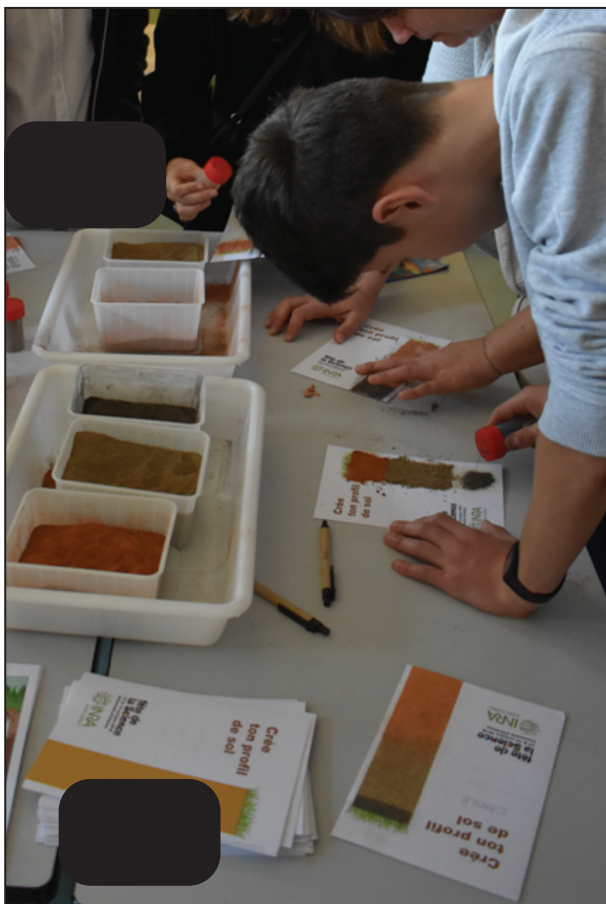
Figure 2 - Tanks with the soil powder.

de sols ou récupérer la poudre de sol directement à la main ( figure 4b ).