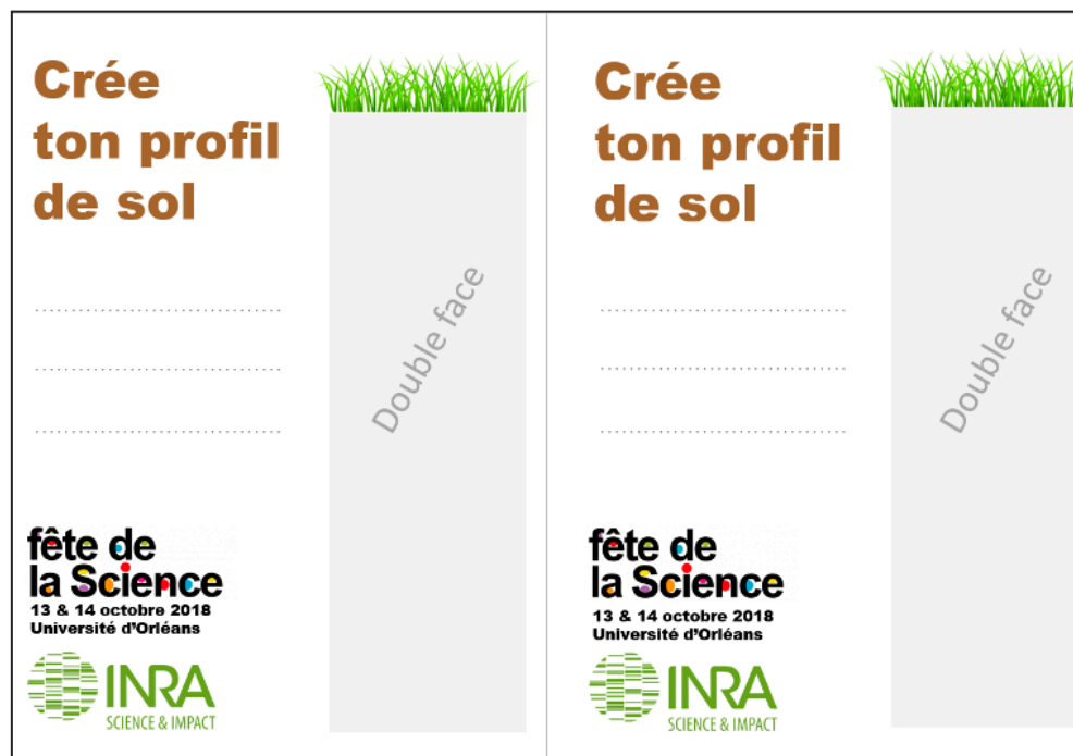
Figure 1 - Model of the cardboard.