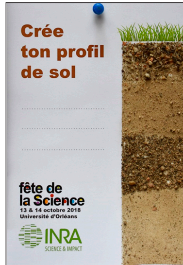
Figure 5 - Soil profile showing different colors and soil textures.

prendre à pleine main les poudres de sol afin de les toucher (d'où l'intérêt d'avoir des sols de textures et de granulométries différentes) et de les positionner plus précisément sur l'adhésif.